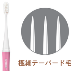
極細テーパード毛